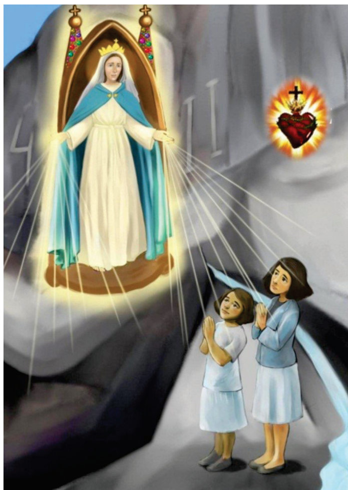
(II Fase das Aparições)